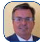
Claude MERMET General Commissioner